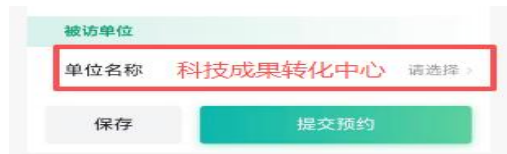
图 14 预约信息填写