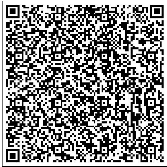
图 13 访客预约二维码

进入访客预约界面后，填写访客身份信息与访问相关内容，填写完成后点击【提交预约】，待被访单位管理员审核通过后，即可以人脸识别的方式进出校园。如图 14 所示。